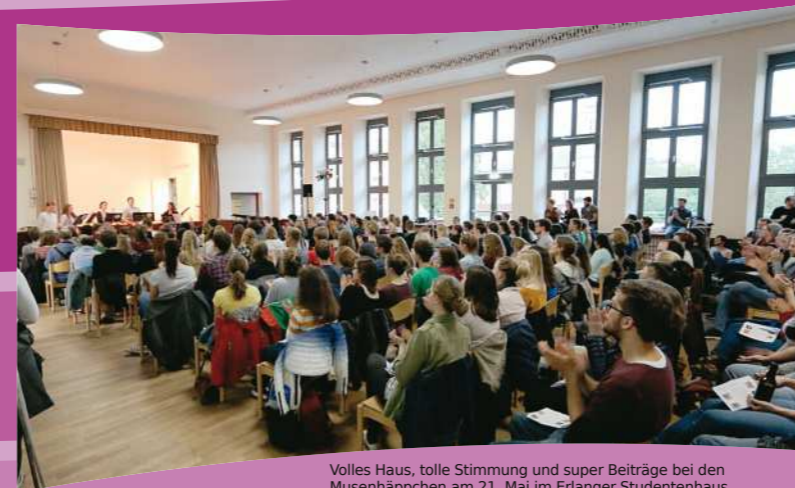
Volles Haus, tolle Stimmung und super Beiträge bei den Musenhäppchen am 21. Mai im Erlanger Studentenheim