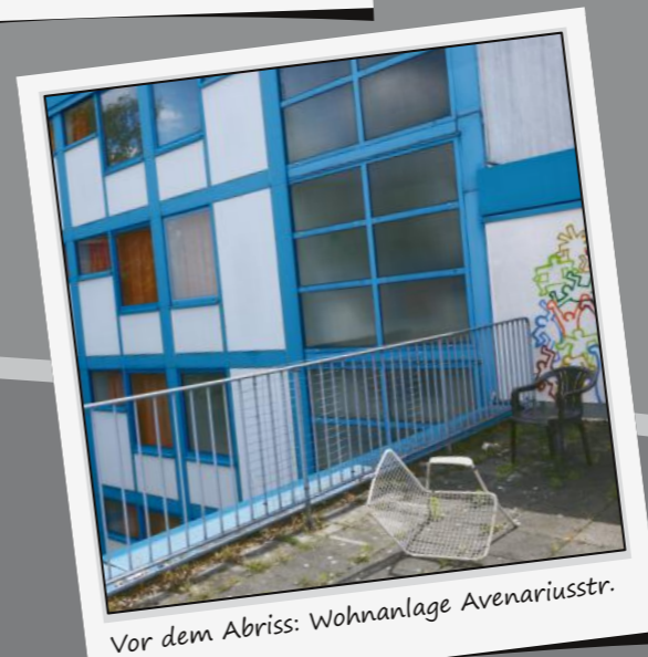
Vor dem Abriss: Wohnanlage Avenariusstr.